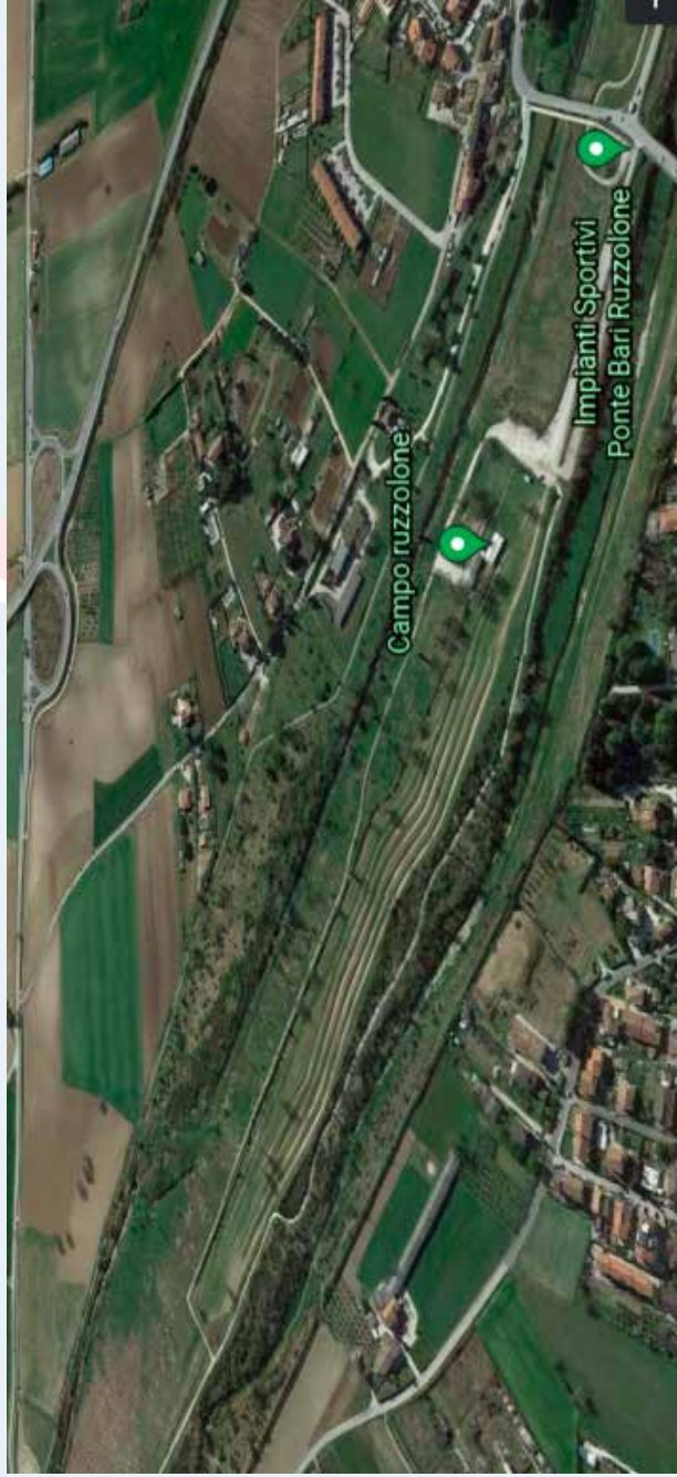
Impianto Sportivo Pontebari vista dall'alto

Impianto "Pontebari" SPOLETO 27-28-29 Agosto '21