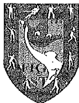
FIG e ST Federazione Italiana Giochi e Sport Tradizionali