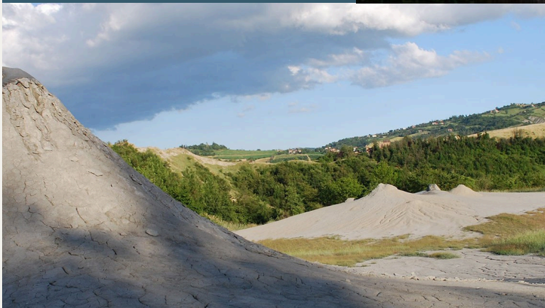
Riserva naturale delle Salse di Nirano