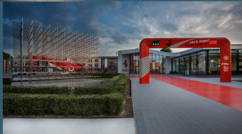
Museo Ferrari Maranello