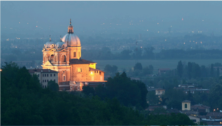
Santuario della Beata Vergine del Castello