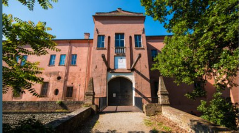
Castello di Spezzano e Museo della Ceramica